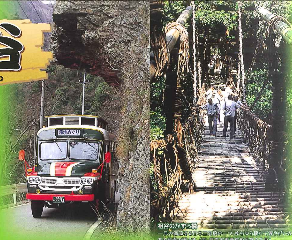
祖谷のかずら橋 一見の価値ある日本三奇橋の一つ、ゆらゆら揺れて渡りがいのある秘境の橋です。(国・県指定重要有形民俗文化財)